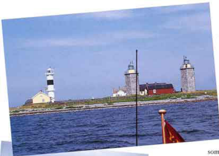
Nidingen på svenskekysten med de tre karakteristiske fyrtårne.