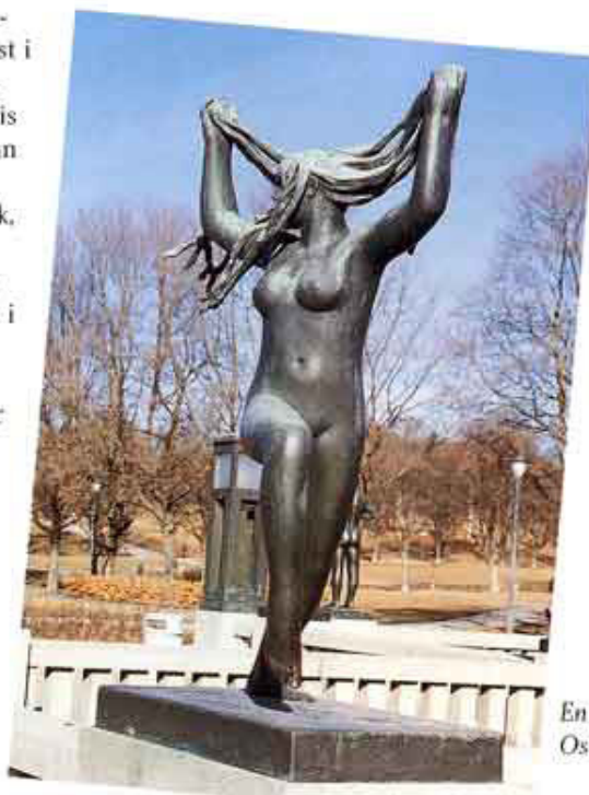
En af mange smukke skulpturer i Oslos Vigelandspark.

Det kan også være en afslappende oplevelse at købe friskfangede pil-selv-rejer af en fisker ved havnekajen og nyde dem sammen med en flaske hvidvin undervejs. Men husk det er ikke tilladt at nyde medbragte alkoholiske drikke på offentlige steder i