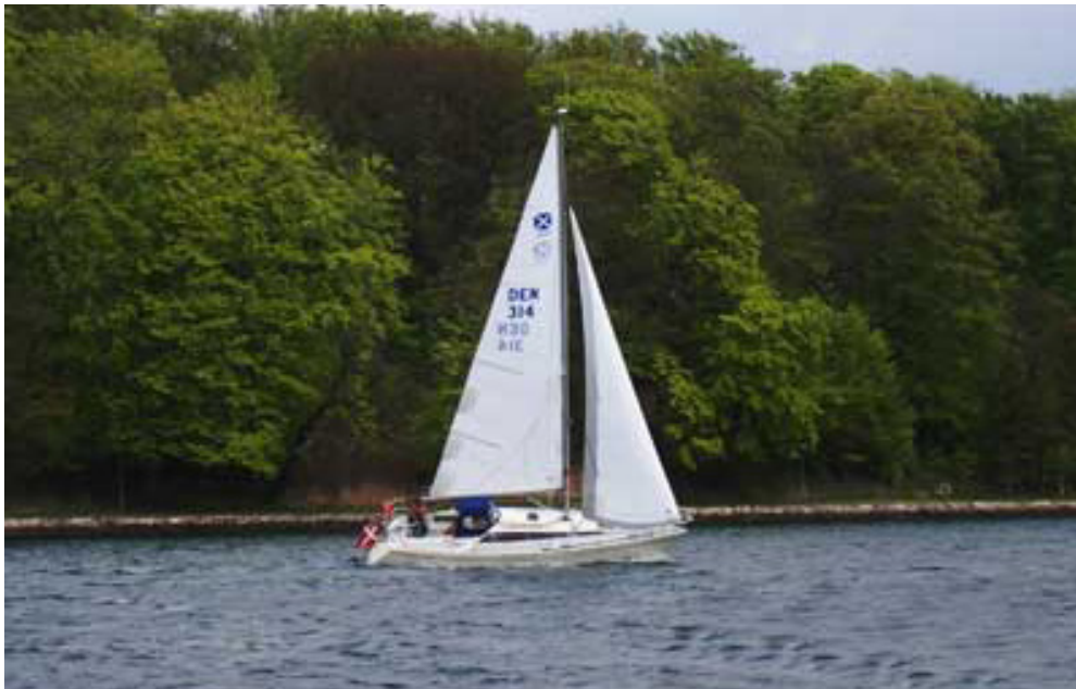
Det gode skib Gaia, en Maxi 999, på kryds i Svendborgsund.