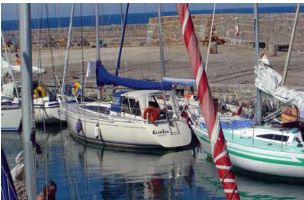
Gaia her fortøjet i Allinge Sandvig.