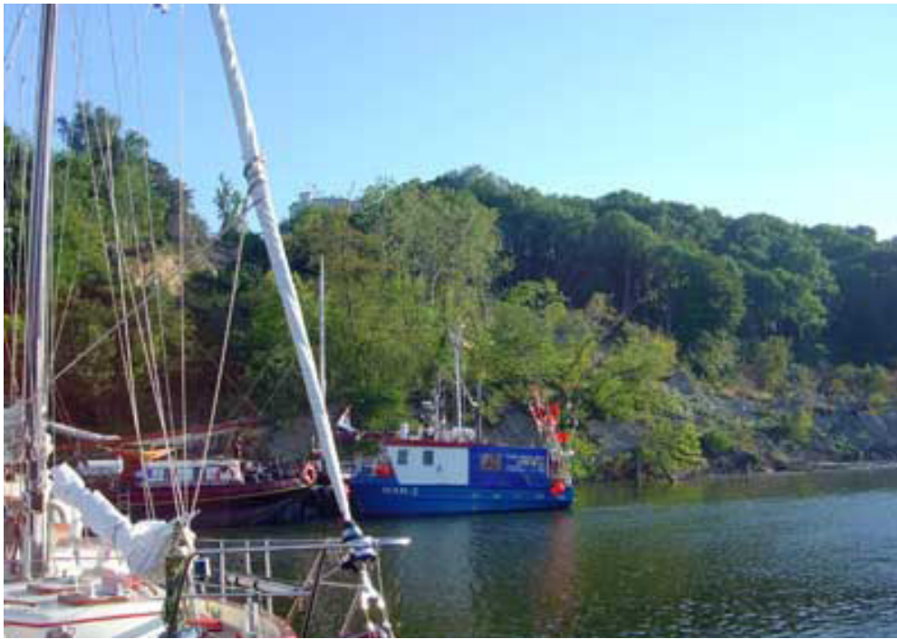
Jordskredet, som var ved at lukke havnen i Lohme på nordsiden af Rügen, var dog sket før vi kom.