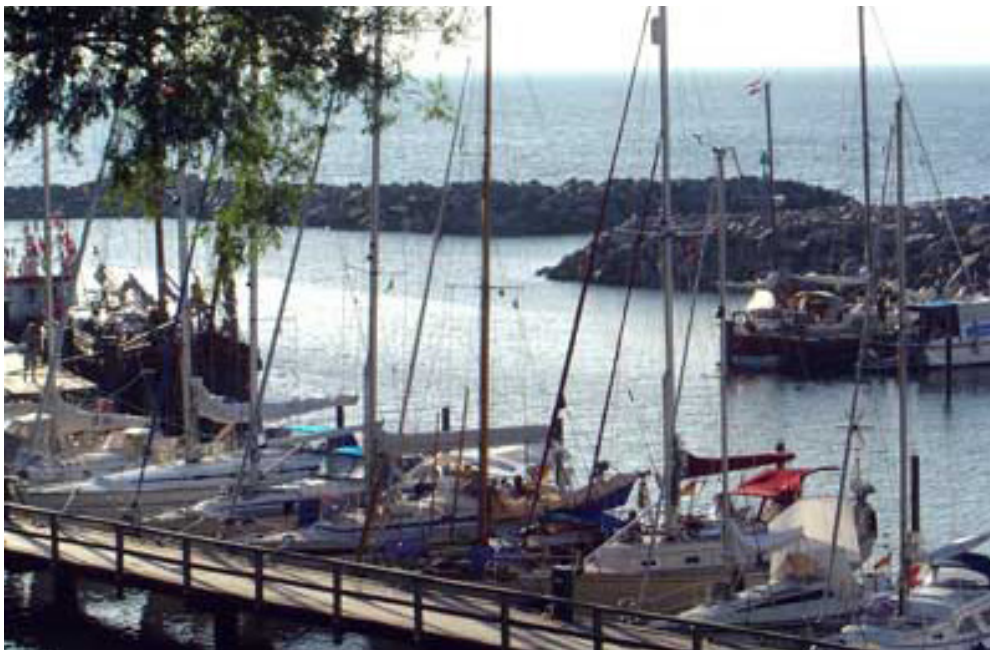
Lohme på nordsiden af Rügen 2006.