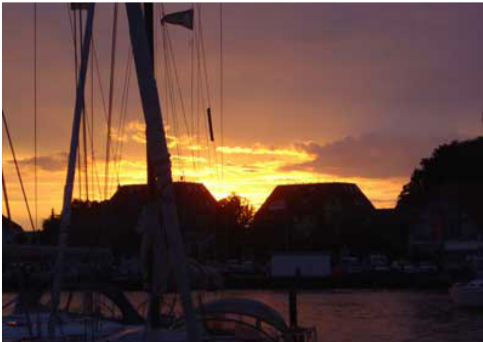
Alle har hørt om den herlige delikatesse Sol over Gudhjem. Her er delikatessen aftenstemning.